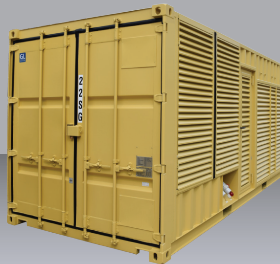
Betriebs- und Serviceabstand rechte / linke Seitenwand 1,00 m und Stirnseiten 1,50 m.