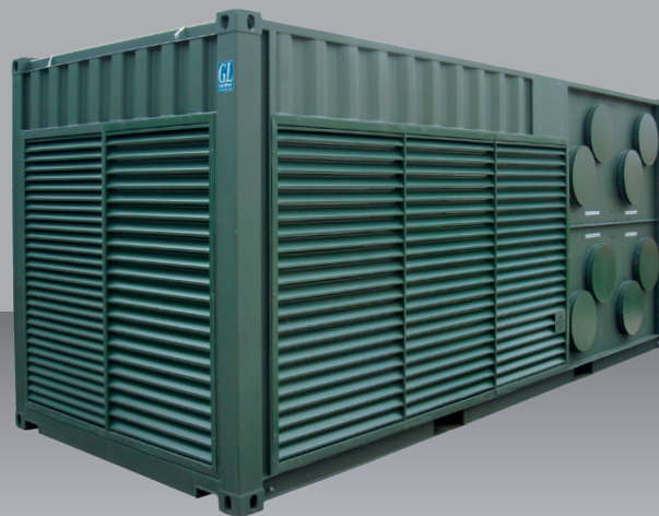
Betriebs- und Serviceabstand rechte / linke Seitenwand 1,00 m und Stirnseiten 1,50 m.