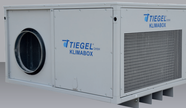
Betriebs- und Serviceabstand umlaufend 1,00 m.